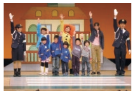
親と子の交通安全ミュージカル(幼児向け)